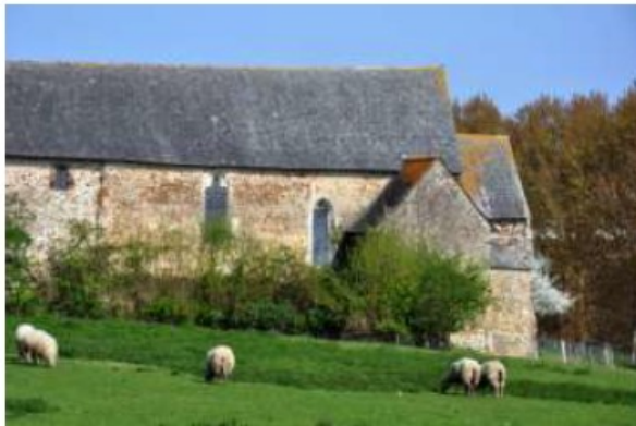
La Chapelle de Pritz