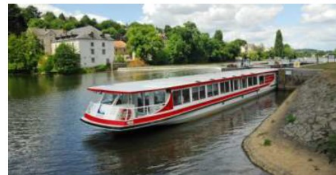
Bateau promenade le Wallis Guidonis